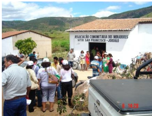
Parceiros da REDSAN-PALOP visitam comunidades e trocam experiências com o Brasil.

O FBSSAN articula a sociedade civil e, em alguns casos, promove ações conjuntas com o Governo. De entre os principais objetivos do FBSSAN destacam-se: i) Mobilizar a sociedade em torno do tema da SAN e colaborar para a formação de uma opinião pública favorável a esta perspectiva; ii) Fomentar a elaboração de propostas de políticas e ações públicas nacionais e internacionais em SAN e Direito Humano à Alimentação; iii) Inserir a temática na agenda política nacional, estadual e municipal e colaborar para o debate internacional sobre o tema; iv) Estimular o desenvolvimento de ações locais/municipais de promoção da SAN; v) Colaborar para a capacitação dos atores da sociedade civil visando otimizar a participação efetiva da sociedade nos diferentes espaços de gestão social; e v) Denunciar e monitorar as respostas governamentais quanto a violações ao direito à alimentação. O FBSSAN participa activamente no Conselho Nacional de Segurança Alimentar e Nutricional (CONSEA). As organizações do FBSSAN assumiram ao longo dos últimos anos um papel relevante na condução dos principais temas tratados pelo CONSEA. Além disso, os últimos presidentes do CONSEA e a actual presidente emergiram de organizações participantes do FBSSAN 24 .