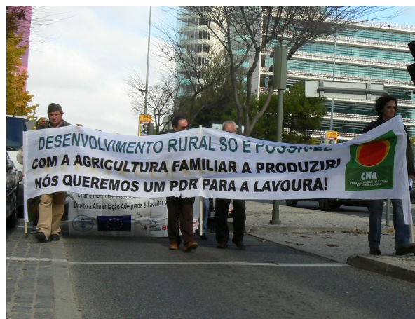
Parceiros da REDSAN-PALOP participam com a CNA em defesa dos pequenos agricultores.

pela ACTUAR em conjunto com outras organizações como a CNA, OIKOS – Cooperação e Desenvolvimento, Instituto Marquês de Valle Flor (IMVF), Saúde em Português, Associação dos Consumidores de Portugal (ACOP), Associação das Mulheres Agricultoras e Rurais Portuguesas (MARP) e Federação Nacional dos Sindicatos do Sector da Pescadores. Estas organizações tomaram a iniciativa de impulsionar um espaço de diálogo, debate e articulação de esforços para fortalecer a intervenção nos processos de formulação e tomada de decisão sobre políticas públicas nacionais e internacionais relacionadas com a SAN, soberania alimentar e direito à alimentação. A ReAlimentar dispõe de uma Carta de