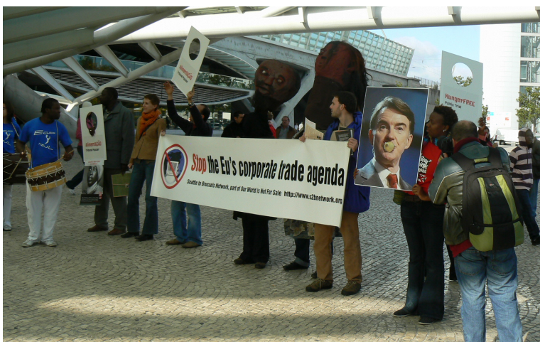
Parceiros da REDSAN-PALOP manifestam-se durante a Cimeira Europa-África (2007) contra os acordos de parceria económica da CE com os países ACP.

(Guiné-Bissau, 2008); “Atelier sobre Direito à Alimentação e SAN” (São Tomé, 2010), incluindo produção de materiais didáticos (Guia de Diagnósticos sobre o Direito à Alimentação (2007), Manual sobre Segurança Alimentar e Nutricional (2010), CD-Rom “Biblioteca Temática sobre Género e Acesso a Terra e Água” (2010), diversos desdobráveis e posters temáticos.