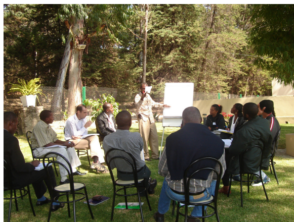
A ROSA partilha a sua experiência com outros países lusófonos em 2007.

Contudo, persistem ainda vários obstáculos a ultrapassar, como sejam: i) Capacidade dos vários membros para assumirem funções de secretariado e (ou) coordenação activa; ii) Limitação de recursos financeiros a vários níveis para a construção de capacidades que permitam uma regularidade no trabalho efetuado, incluindo aspectos logísticos e administrativos; iii) Dificuldade de descentralização para as províncias; iv) Lacunas em termos de visibilidade e comunicação a vários níveis.