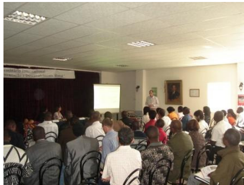
Participantes do Seminário Internacional Direito à Alimentação e Segurança Alimentar realizado em Angola.

A realização desse seminário em Angola foi muito importante, pois ocorreu num momento particularmente oportuno para o envolvimento da sociedade civil na discussão sobre a construção da política de SAN, na altura em início de formulação no país. Esse evento contou com uma ampla cobertura de imprensa, com a participação dos governos locais e central e possibilitou a partilha de experiências com redes da sociedade civil de outros países lusófonos, como a ROSA de Moçambique, e representantes do CONSEA do Brasil. No final do seminário, as organizações