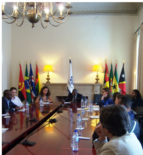
Parceiros da REDSAN-PALOP reunidos em audiência com Secretário Executivo da CPLP em Outubro.

Este processo foi reconhecido como fundamental pela própria CPLP durante a audiência que o Secretário Executivo, Domingos Simões Pereira, manteve com a REDSAN-PALOP em Outubro de 2011 em Lisboa. Nessa altura realizou-se em Lisboa a IV Reunião da REDSAN-PALOP, facilitada pela ACTUAR. Nesta oportunidade, a ACTUAR mobilizou organizações de Portugal e Brasil no sentido de discutir com as demais redes dos PALOP o processo de alargamento da rede regional para o espaço da CPLP. A ACTUAR está igualmente a reforçar os contactos com organizações de Timor-Leste para o mesmo efeito.