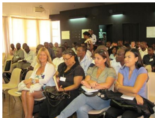
Participantes do Fórum de Políticas Públicas para a Agricultura e SAN realizado em São Tomé e Príncipe.

O esforço empreendido até ao momento tem sido reconhecido pelo governo e outros actores, sendo a RESCSAN-STP chamada a participar no processo de formulação da estratégia nacional de SAN finalmente retomado em 2011 com apoio técnico da FAO.