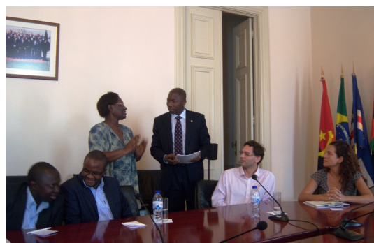
Secretário Executivo da CPLP recebe contributos da REDSAN-PALOP para a estratégia regional de SAN.

Durante o primeiro semestre de 2012 decorrerá a fase de detalhamento dos planos de acção e a estruturação dos órgãos de governança da estratégia, em particular o Conselho Regional de SAN da CPLP, órgão inter-ministerial de assessoria à Cimeira de Chefes de Estado da CPLP.