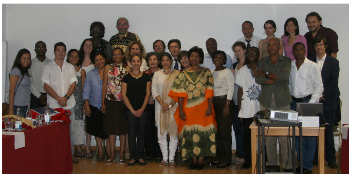
Parceiros da REDSAN-PALOP trocam experiências e definem estratégias com FAO e CPLP no seminário sobre género e acesso a recursos naturais em Lisboa em 2010.

No seguimento, estabeleceu-se um grupo de coordenação e acordou-se uma base de entendimento para a intervenção da rede. Estes princípios foram plasmados num regulamento no qual se definem os objectivos, missão, estrutura, mecanismos de governança e funcionamento da ROSA. Desde então, o processo de construção e fortalecimento da ROSA foi mais rápido, em parte graças ao apoio recebido de algumas organizações internacionais, entre as quais e a mais importante, o projecto IFSN. Este projecto permitiu à ROSA dispor de meios para ter um coordenador a tempo parcial, custear encargos básicos com a facilitação da rede e participar em intercâmbios com outras redes e organizações, tanto no espaço da CPLP como noutros países.