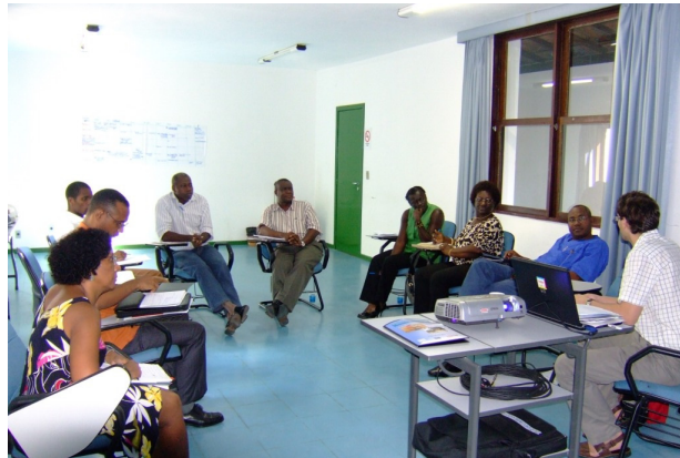
Parceiros da REDSAN-PALOP na II Reunião Regional realizada em Olinda (Brasil) em 2008.

A PONG's tem participado em inúmeras iniciativas de troca de experiências promovidas pela REDSAN-PALOP, ajudando a impulsionar processos de articulação noutros países e promovendo a partilha de informação sobre diversos temas relevantes para outros grupos de trabalho e redes, incluindo, por exemplo, o tema do acesso à água e conservação da biodiversidade, entre outros.