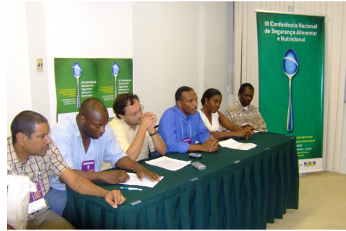
Lançamento da REDSAN-PALOP em Fortaleza em 2007.

A REDSAN-PALOP foi formalmente lançada durante a III Conferência Nacional de SAN realizada em Fortaleza (Brasil) em Junho de 2007. No momento da sua criação definiu-se um conjunto de prioridades que ditaram a sua estratégia de intervenção nos anos subsequentes: i) Reforçar as acções de intercâmbio e troca de experiências entre os diferentes PALOP aumentando o nível de informação e conhecimento sobre a temática da segurança alimentar e nutricional, da soberania alimentar e do direito humano à alimentação; ii)